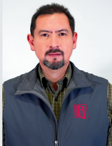
Lic. David Fuentes Dirección de Acceso a la información pública y protección de datos personales