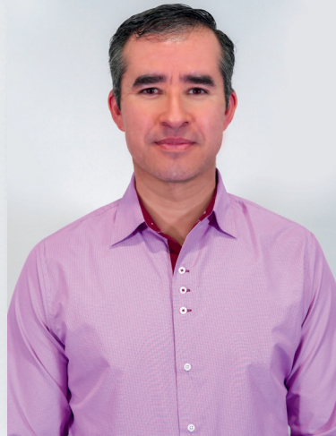
Lic. Oswaldo Peregrino Dirección de Acceso a la información pública y protección de datos personales